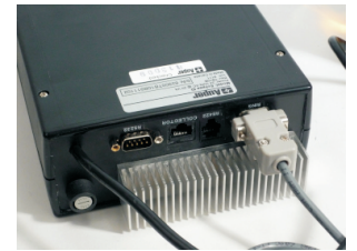
Dissipateur et ports

Servez un verre de vin de 150 ml en cinq seconde.