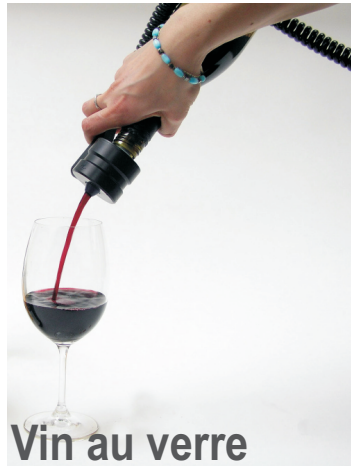
Vin au verre

Servez un verre de vin de 150 ml en cinq seconde.